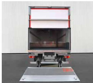
Ladebordwand mit Heckklappe