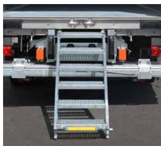
Aufstiegstreppe mit Bodenkontakt