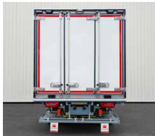
Heckrahmen mit drei Tür-Flügeln