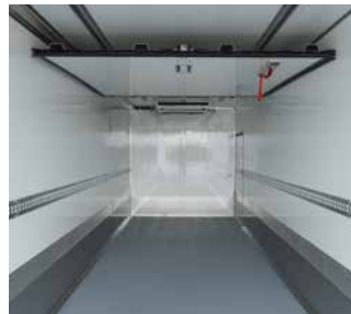
Quertrennwand, längsverschiebbar und hochklappbar