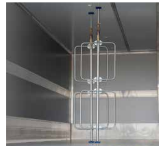
Ladungssicherungsstangen mit Bügeln

Entdecken Sie zahlreiche Optionen, um Ihren Fahrzeugaufbau perfekt an Ihre Anforderungen anzupassen – bitte beachten Sie, dass nicht alle Ausstattungsmerkmale für jedes Modell verfügbar sind.