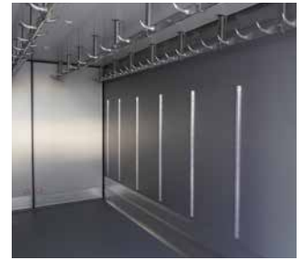
Innenverkleidung aus Edelstahl oder Aluminium