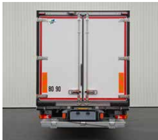
Heckrahmen mit zwei Tür-Flügeln