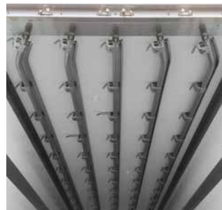
Fleischhang und Hebesystem