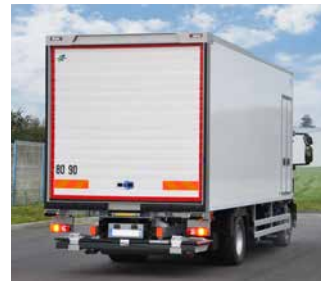
EasyAcc' Air Rolltor vollautomatisch