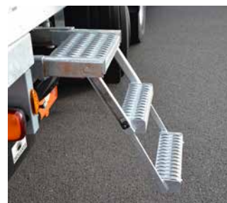
Seitlich ausziehbare Aufstiegstreppe