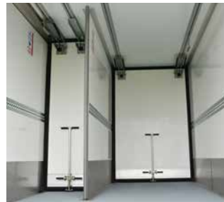
Längstrennwand mit Schiebeelementen