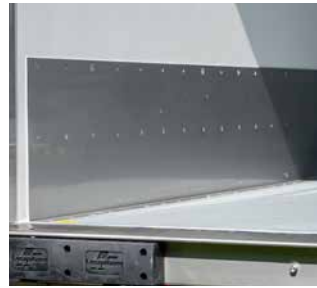
Sockelleiste aus Edelstahl